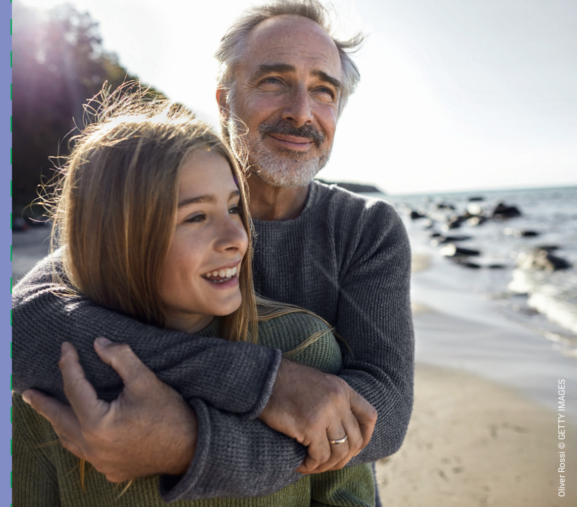
Oliver Rossi © GETTY IMAGES

Метастатичен рак на стомаха (мРС) – симптоми и лечение